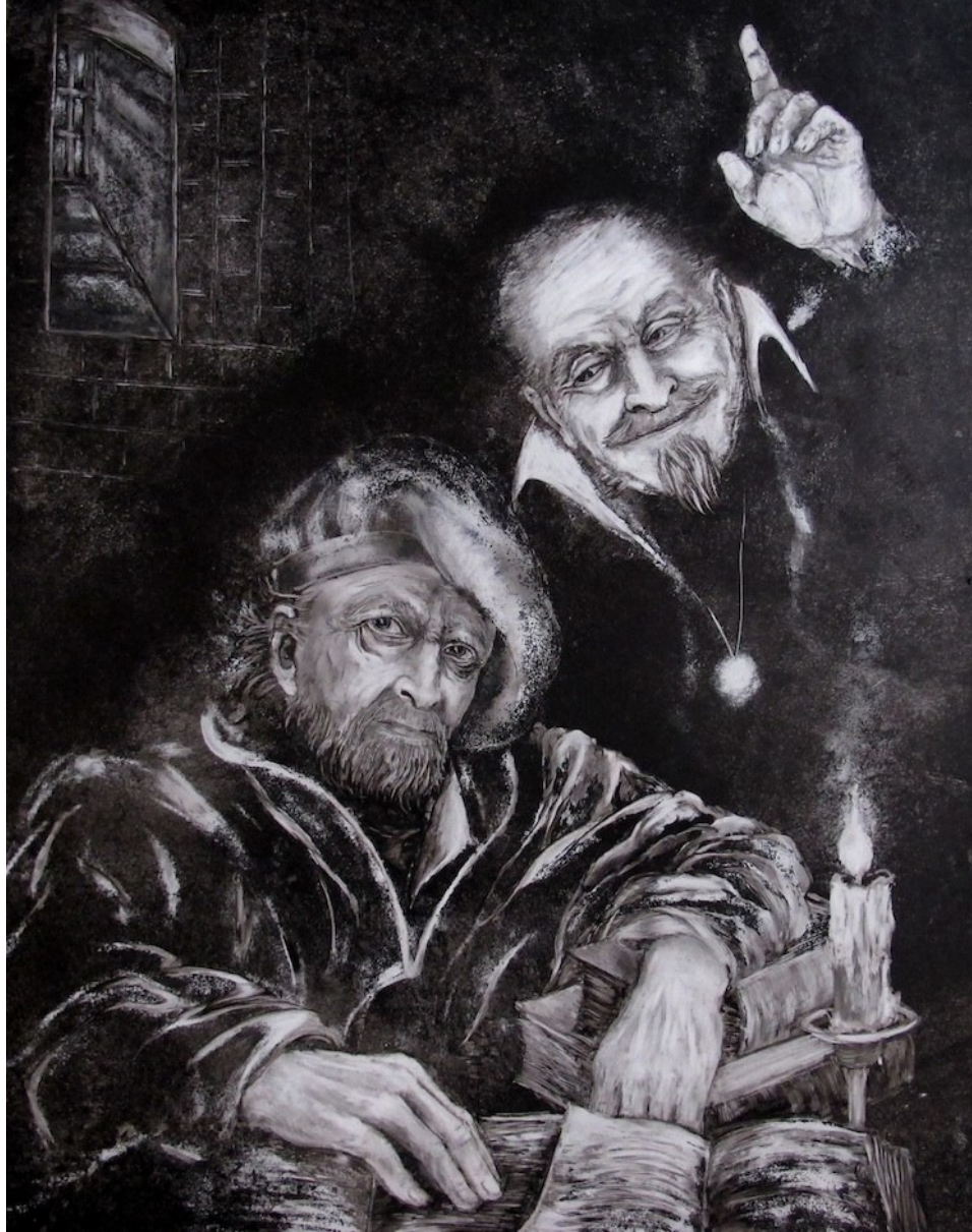
Диалог Фауста и Мефистофеля Выполнено тушью на бумаге Уиро, 66 x 50 см, 2013