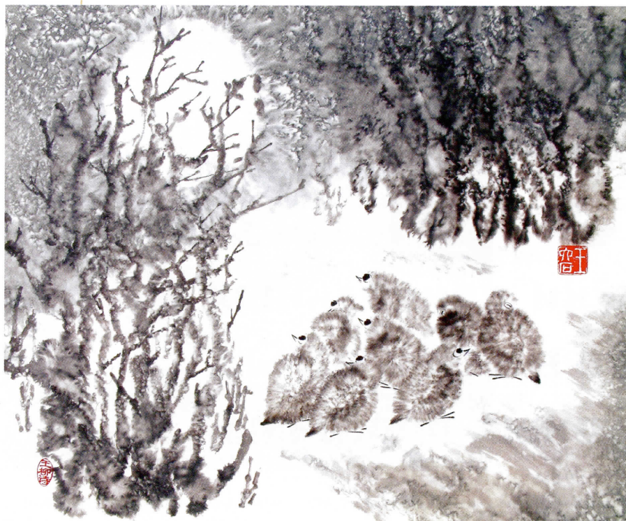
КАРТИНА ВАН ЛЮШИ «ПОЛНОЛУНИЕ»