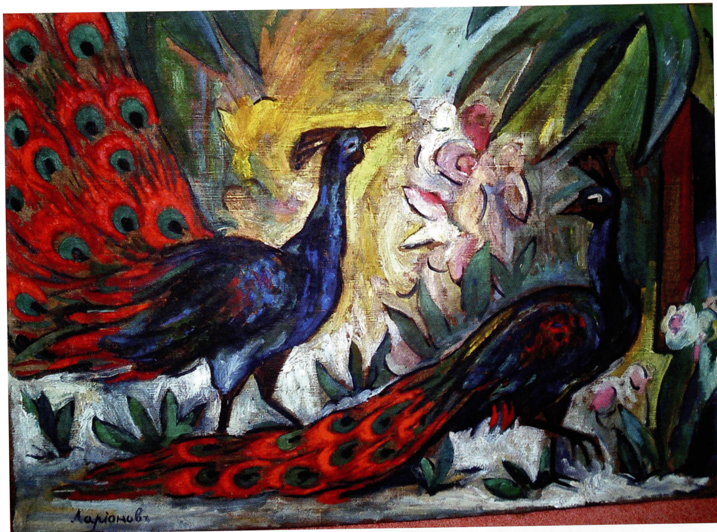
КАРТИНА М. ЛАРИОНОВА «ПАВЛИНЫ»

Китайская живопись – это тоже плоскостное изображение, здесь нет объёма в европейском понимании, а есть удаление и приближение. Нет и перспективы, а есть только точка обзора.